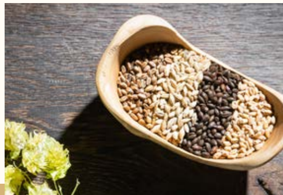
Die Gerstenmalze des St. Ulrichsbocks: Helles Gerstenmalz, Röstmalz, helles und dunkles Caramelmalz.

Das gilt auch für den St. Ulrichsbock. Sein bernsteingoldenes Aussehen ist eine Augenweide, sein würzig-fruchtiger Charakter ein vollmundiges Trinkerlebnis. Auch hier werden mit vier Malz- und gleich zwei Hopfensorten gearbeitet. Der St. Ulrichsbock ist die Mutter des kleinen Ulrichsbiers aus dem kleinen Bügelverschlussfläschle, gewidmet dem Kirchenpatron der Kapelle in Berg.