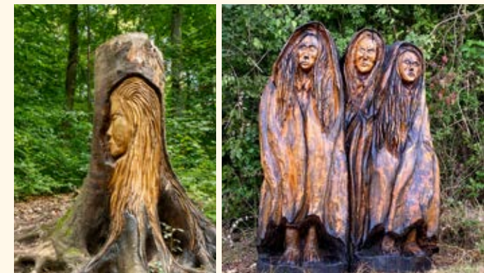
Bild links: Das Gesicht der Urschel begrüßt die Wanderleute auf ihrem Berg. Bild rechts: Die Nachtfräulein der Pfullinger wohnen der Sage nach im Ursulaberg.