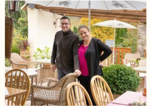
Mit tollem Ausblick in den idyllischen Hinterhof.

Die Köche sind durchgehend von 10 bis 22 Uhr am Werk und bereiten die Gerichte frisch zu. Ihre bunt gemischte Gästeschar hat die Wahl zwischen Salaten, Nudelgerichten,