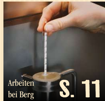
Arbeiten bei Berg