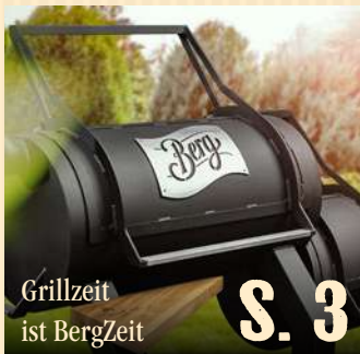
Grillzeit ist BergZeit