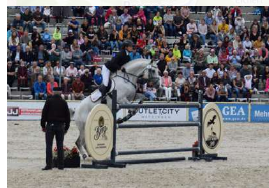
Hengstparade im Haupt- und Landgestüt Marbach.

Pferde gehören zum Großen Lautertal wie das Wasser seines Flusses und die Burgen auf seinen Felsspitzen. 45 Kilometer lang windet sich das naturnahe Gewässer durch die Höhenzüge der Alb. Die Lauter entspringt in Offenhausen, gleich hinter dem Gestütsmuseum, das einmal ein Kloster war, und mündet bei Lauterach in die Donau. Dazwischen liegt ein Tal der Superlative voller Natur und Kultur und genussreicher Erlebnismöglichkeiten.