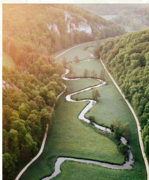
Blick von der Ruine Maisenburg ins Tal.