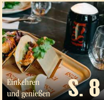
Einkehren und genießen