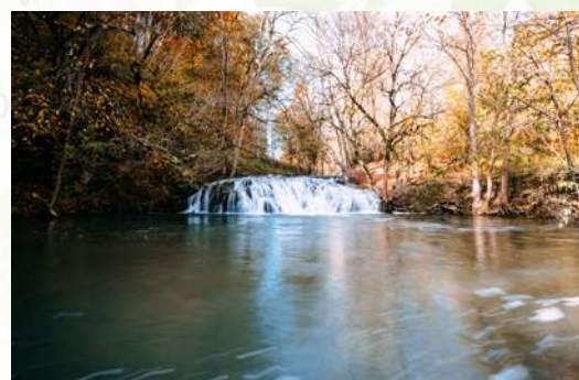
Wer dem Lauf der Lauter lauscht, entdeckt auch manche wilde Stelle.

In Bichishausen beginnen die Kanutouren auf der Lauter, ein überaus beliebtes Wasservergnügen, das auch für Anfänger problemlos machbar ist. Vom 3. Juli bis 29. September dauert die Saison, immer von Montag bis Freitag.