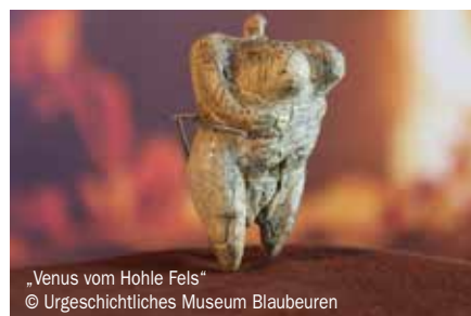
„Venus vom Hohle Fels“

Die Schwäbische Alb war in vorgeschichtlicher Zeit besiedelt. Davon zeugen sechs Höhlen und die umliegende Landschaft, die unter dem Titel „Höhlen und Eiszeitkunst der Schwäbischen Alb“ in die UNESCO-Welterbeliste eingetragen sind. Höhlenfunde und Kunstwerke belegen eine frühe Besiedlung vor 40.000 Jahren und zeigen, dass in unserer Region die Wiege der Kunst und Kultur zu finden ist. Neandertaler und anatomisch moderne Menschen lebten hier während der letzten Eiszeit. Die Funde sind Nachweise der ersten menschlichen Versuche, Tiere und Menschen figürlich darzustellen. Die wohl bedeutendsten Funde sind der „Löwenmensch“, ein geheimnisvolles Mischwesen aus Mensch und Löwe, und die „Venus vom Hohle Fels“, die zugleich die älteste figürliche Darstellung